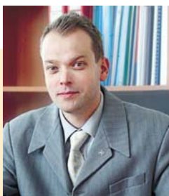
Dimitar Tzvetanov Direttore generale - Registro del Ministero della Giustizia bulgaro

„La possibilità di accedere al pool di documenti centrale da tutte le sedi ha considerevolmente semplificato tutte le attività. Possiamo ora fornire un servizio più rapido ed efficiente in tutto il paese e ridurre ulteriormente lo spazio di archiviazione.“